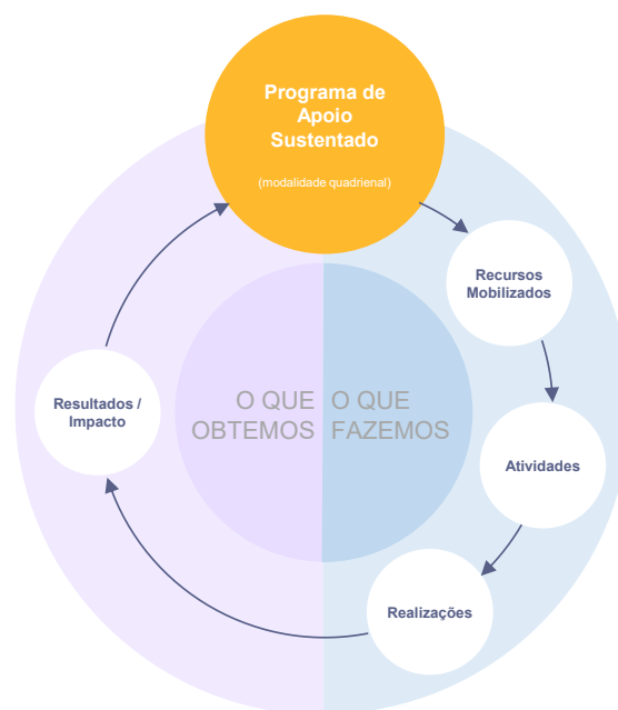
Figura 3 –Enquadramento dos indicadores no ciclo de vida do PAS4

organizado numa Base de Dados (BD) onde consta a proposta de indicadores de monitorização / avaliação do PAS4 organizados em função das dimensões-chave da TM e na qual se inclui para cada um a informação relativa aos seus principais elementos de caracterização.